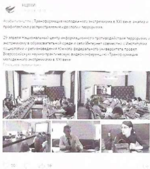
Рисунок 12 – Информация о прошедшем мероприятии