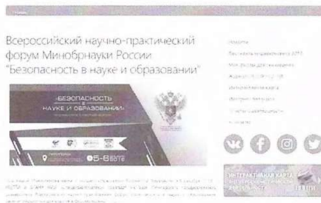
Рисунок 2 – Краткий пресс-релиз

Краткий пресс-релиз обычно содержит информацию с приглашением посетить мероприятие, зарегистрироваться или получить аккредитацию для представителей СМИ. Пример размещенного пресс-релиза продемонстрирован на рисунке 2.