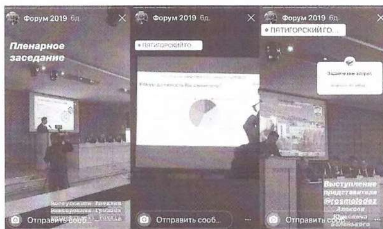
Рисунок 4 – Онлайн-репортаж мероприятия в социальной сети Instagram

Онлайн-трансляция мероприятия в сети Интернет подразумевает информирование пользователей о происходящем в режиме реального времени и подразделяется на типы: текстовая трансляция, видео или аудио. Допускается комментированный онлайн-фоторепортаж. Функционал современных социальных сетей позволяет вести прямые трансляции, используя все типы контента одновременно. Пример онлайн-сопровождения мероприятия с помощью функционала социальной сети Instagram на рисунке 4.